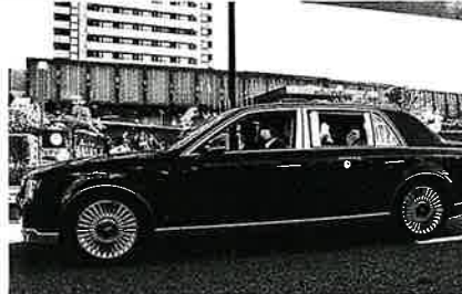
天皇皇后両陛下の御移動