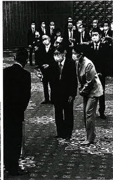
会場での天皇皇后両陛下の御様子

漁業振興を目的に1981年から始まり、上皇上皇后両陛下が御臨席されてきた。「全国植樹祭」「国民体育大会」「国民文化祭」ともにいわゆる「四大行事」の一つ。