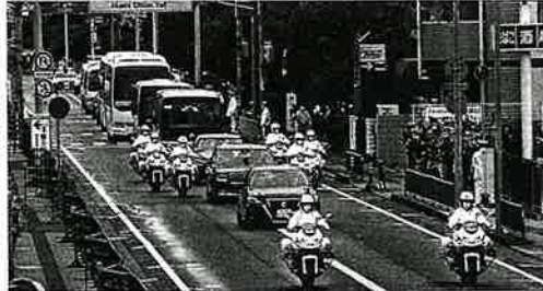
自動車お列の状況