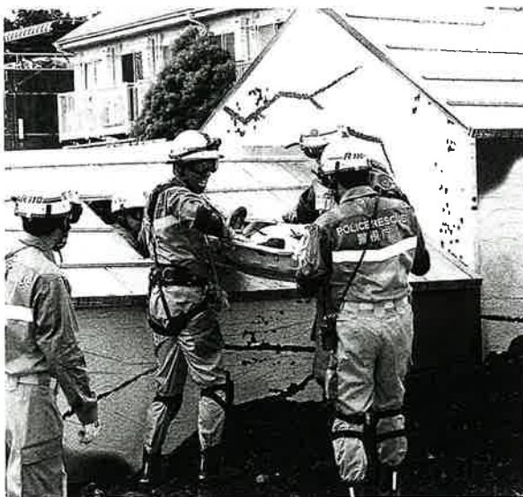
倒壊家屋に閉じ込められた要救助者を救出

の命を守るよう、日頃からの備え、訓練を継続していこう。今年も関東大震災からちょうど100年の節目の年。震災では多くの人が火災で尊い命を失った。地域の自助・共助の取り組みこそ、多くの命を救い、被害の拡大を防ぐ。「備えよ、常に」の精神で日頃の備えや訓練に取り組み、地域の防災力をさらに高めていただきたい」と述べた。