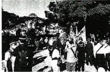
原爆ドーム北側の対応に当たる機動隊員等(広島)