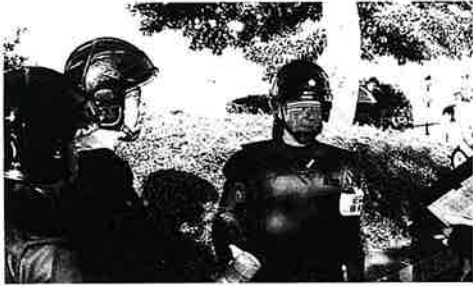
デモ規制前に隊員に指示をする機動隊中隊長(広島)