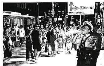
歩行者への警備広報