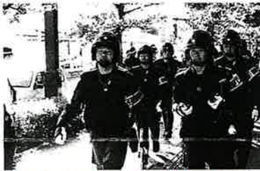
デモ規制の現場へ転進する管区機動隊小隊(広島)