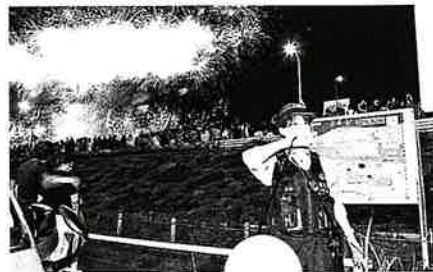
河川敷での警備広報