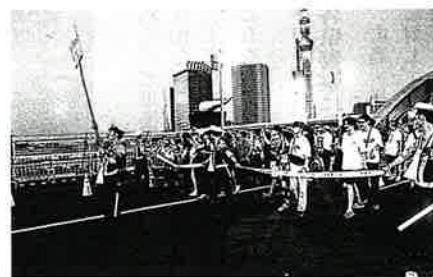
橋上での雑踏警備