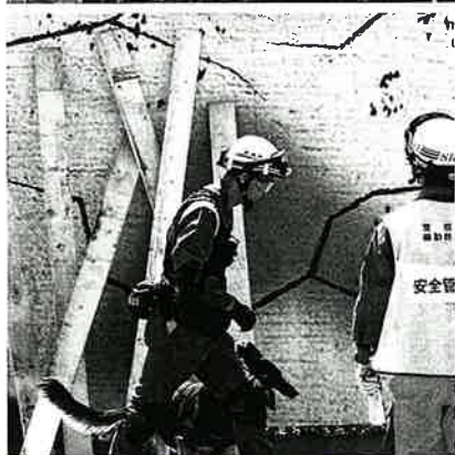
倒壊家屋の周辺にて要救助者を捜索する警備犬