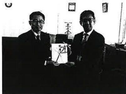
長崎県警察にて。自見九州支部長(右)と中村長崎県警察本部長