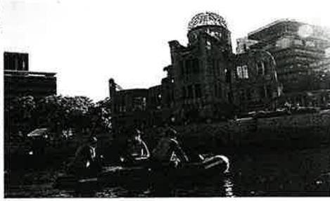
河川を警戒する機動隊突発対策部隊(広島)